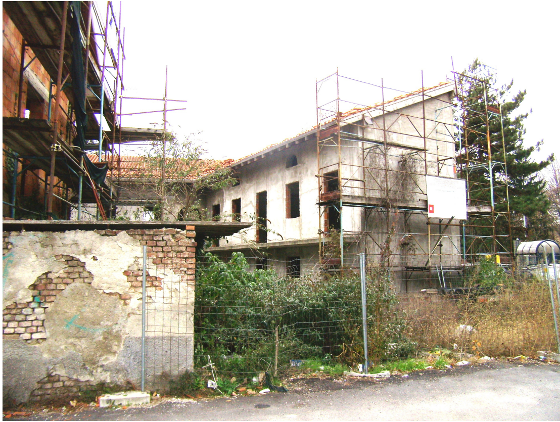
la vecchia cascina lombarda

L'area in questione si colloca all'interno di un sistema urbano consolidato quindi dotato di tutti i servizi legati sia alla mobilità del trasporto pubblico che privato, sia di strutture commerciali disposte nelle immediate vicinanze che di sistemi legati allo svago e quindi alla fruibilità degli spazi verdi pubblici disponibili.